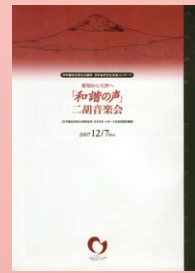
プログラム裏表紙